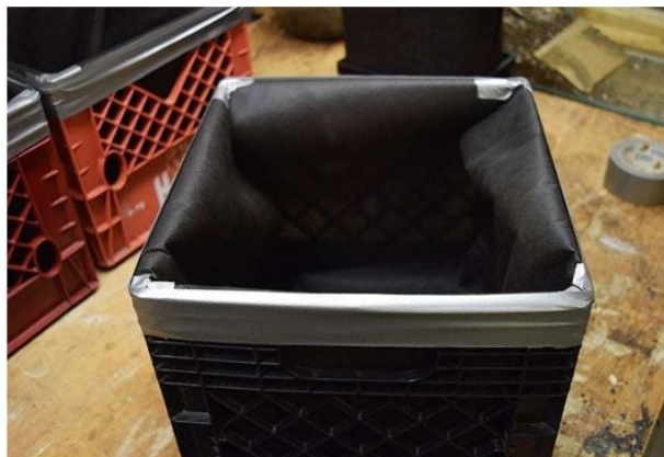
آماده سازی جعبه برای کشت زعفران در جعبه